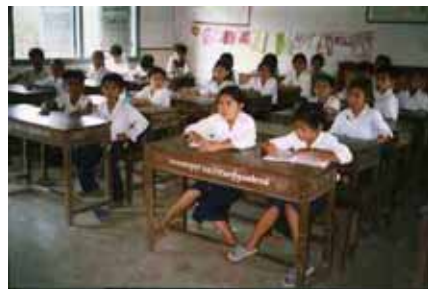
フレンドリーデーについてお勉強中