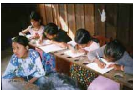
アンケートに回答しています