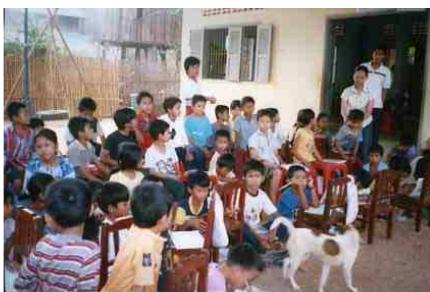
犬も一緒に仲良くレクチャーを受けました！