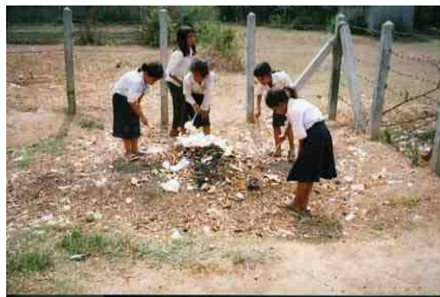
拾ったゴミを燃やしました