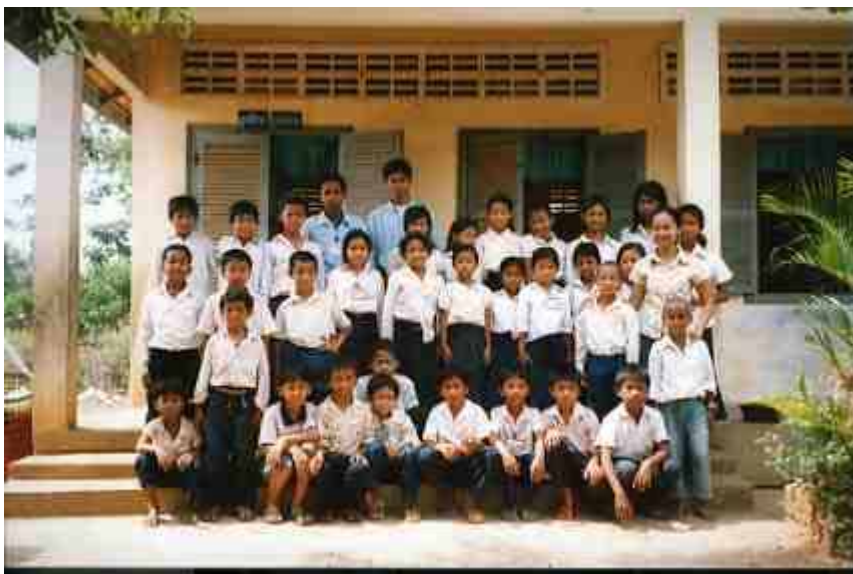
4.14 Friendly Day Eventに参加した子どもたち