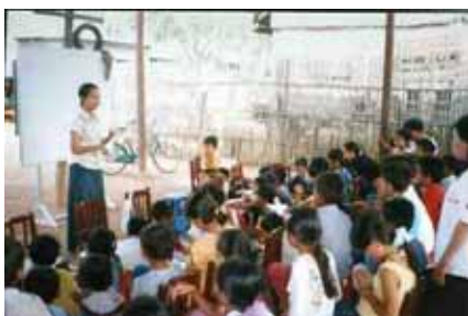
フレンドリーデーって楽しそう！